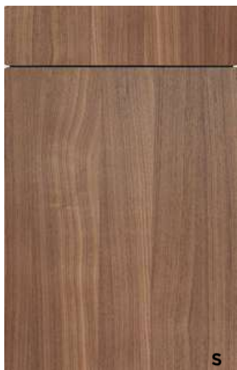
(S26/cp) PG 7 Sydney/-cp 552 - FG 318 Nussbaum Walnut