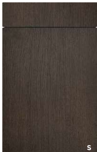
(S26/cp) PG 7 Sydney/-cp 552 - FG 319 Eiche geräuchert Smoked oak

Naravno trajnostne fronte iz lesenega furnirja v dom vnesejo prijetno toplino in sproščeno eleganco. Naravno pridobljen material je z veliko natančnostjo in skrbnostjo nanesen v obliki furnirja na certificirane lesne plošče. Poseben visokokakovosten zaščitni lak furnir dodatno ščiti pred vlago, umazanijo in praskami.