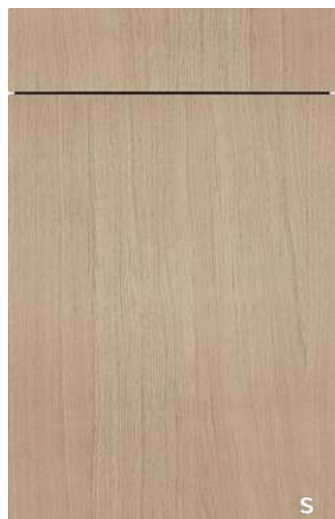
(S26/cp) PG 7 Sydney/-cp 552 - FG 323 Eiche hell Light oak