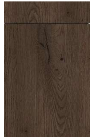
PG 2 (B22/cp) Bergen/-cp 154 Eiche geräuchert Smoked oak