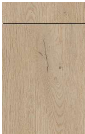
(B22/cp) Bergen/-cp 150 Eiche hell Light oak

trpežna in enostavna za vzdrževanje, zaradi usklajene teksture in videza lesnih vlaken skoraj nerazločljiva od pravega lesenega furnirja.