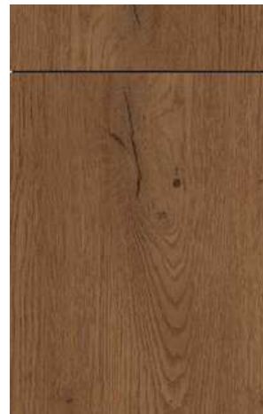
PG 2 (B22/cp) Bergen/-cp 153 Eiche Cognac Cognac oak